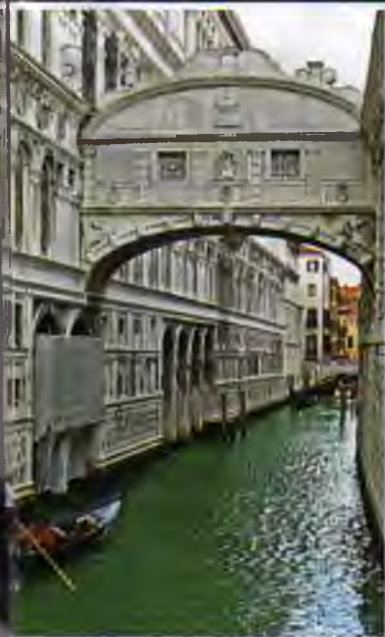
Nopūtu tiltiņš, ļoti iespējams, ir tūristu fotoaparātos visbiežāk iemūžinātais Venēcijas objekts.