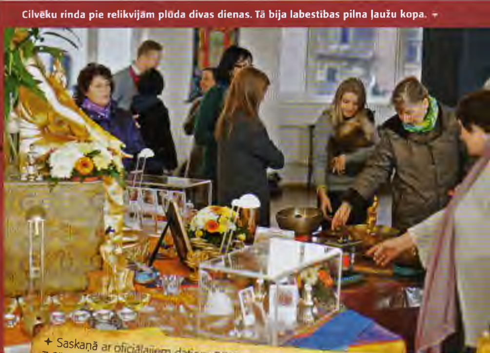
Cilvēku rinda pie relikvijām plūda divas dienas. Tā bija labestības pilna ļaužu kopa. →

Ringsel vēsturiski tika glabātas klosteru pagalmos par godu šiem skolotājiem atbilstoši uzceltās stupās vai telpās, ievietotas mazākās stupās vai statujās."