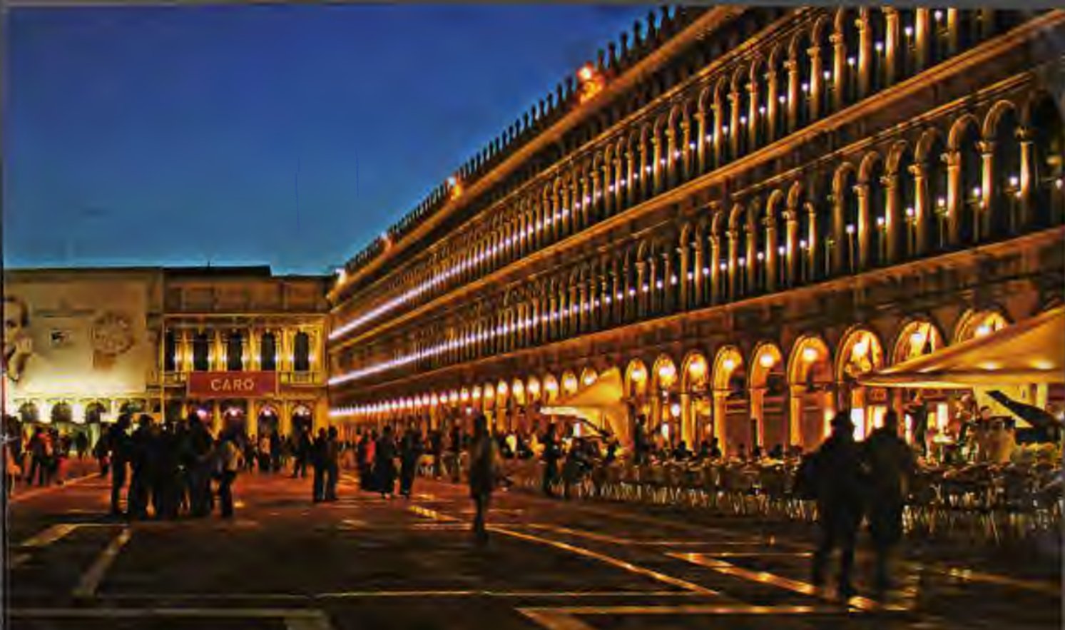
Svēta Marka laukums ar savu plašumu un varenību apņem gan fiziski, gan emocionāli. Kad tur stāv un iedomājas, kādi ļaudis gadsimtu gaitā laukumu šķērsojuši, ķermeņi pārņem vibrējoša enerģija.