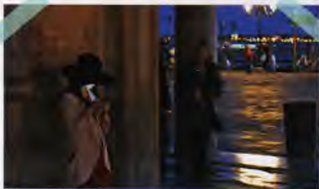
Vismistiskākā Venēcija kļūst, iestājoties naktij, tad izzūd laika un telpas robežas.

Kurš tad nav redzējis gondolas, Venēcijas maskas un Svētā Marka laukuma baložus? Par to salu taču zināms viss pat tiem, kuri tur nav bijuši... Arī es tā domāju līdz brīdim, kad uzdūros Venēcijas noslēpumainajai mistikai, kuru atšķetināt man neizdevās.